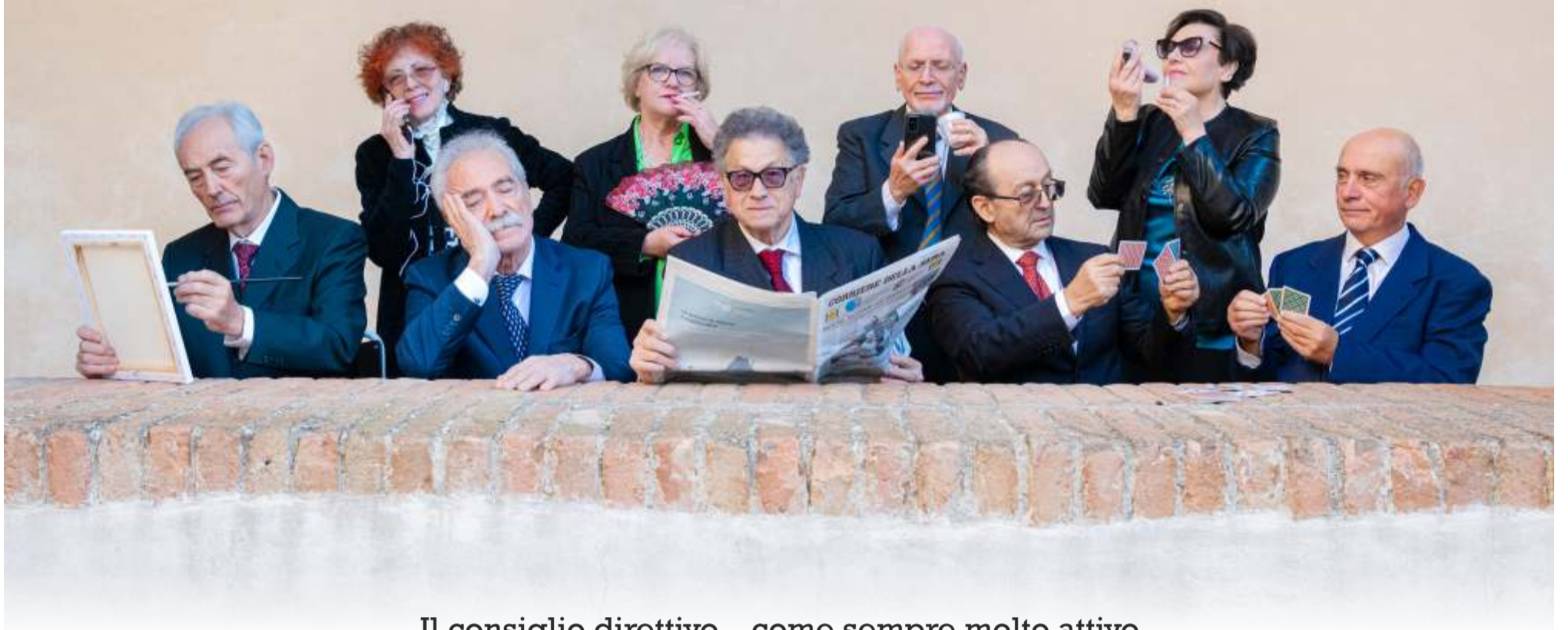
Il consiglio direttivo... come sempre molto attivo Invia a tutti senz'affanno... Buone feste e buon anno!